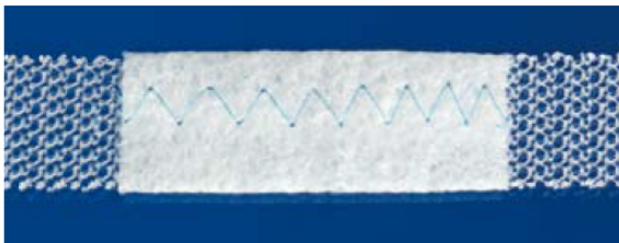
IUFA com área central suburetral reforçada que minimiza a taxa de possível erosão graças ao seu suave setor central.

Dimensões: largura 11 mm, comprimento 420 mm Zona de proteção central: 3 cm no modelo IUFA Tensão de ruptura aproximada: 6,8 a 7 Kg. Diâmetro de filamento: 180 µm